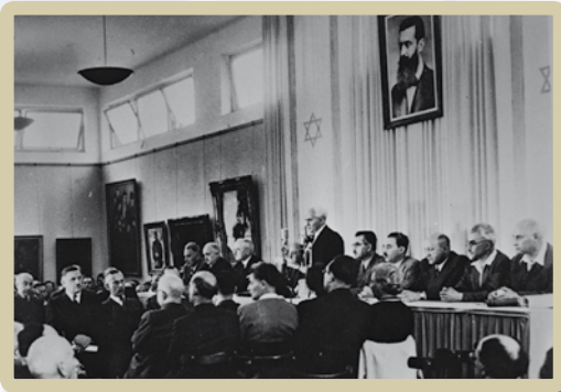
"אנו מכריזים בזאת..." דוד בן גוריון קורא את נוסח המגילה בפני ציגיי היישוב העברי והתנועה הציונית (לפני העיתונות הממשלתית)

זוהי זכותו הטבעית של העם היהודי להיות ריבון בארצו בכל עם אחר