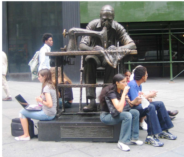
פסל רחוב באזור בו שכנו "בתי היזע" בראשית המאה ה-20; ניו יורק, ארה"ב, 2008. (עטרה וולק)

רבים מהיהודים אשר היגרו לארצות הברית עסקו בתחילה במקצועות הקשורים לתעשיית הטקסטיל, בעיקר בתחומי החייטות והרוכלות. הפנייה לתעשיית הטקסטיל נבעה מהעובדה שעיסוק זה לא הצריך ידע ומומחיות. היהודים הועסקו כפועלים פשוטים בתנאי עבודה קשים, במבנים שזכו לכינוי הלא מחמיא בתי יזע.